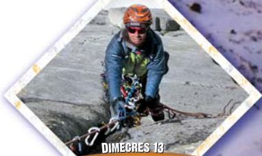
DIMECRES 13 DESTINO KARAKORUM A càrrec de Cecília Buil