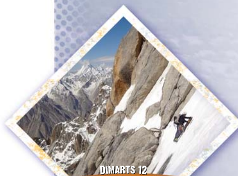
DIMARTS 12 PAIJU PEAK LOS PILARES DEL BALTORO A càrrec de Juan Vallejo

Aquest reconegut alpinista basc ens mostrarà les dificultats que van haver de superar per dur a terme una de les rutes més complicades en una muntanya colossal de 6.610 metres en la serralada del Karakorum: el Paiju Peak (el Pakistan).